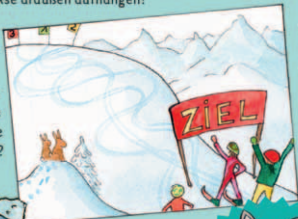
Der Skifahrer mit der Startnummer 1.

Rätsel: Wer ist im Rennen die kürzeste Strecke gefahren?