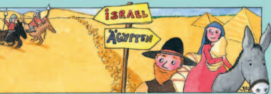
Auflösung: Ein Engel.

aus der christlichen Kinderzeitschrift Benjamin