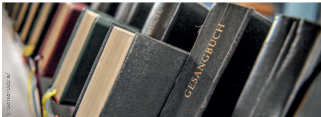
500 Jahre Gesangbuch ... hier einige Vorläufer der aktuell genutzten Fassung